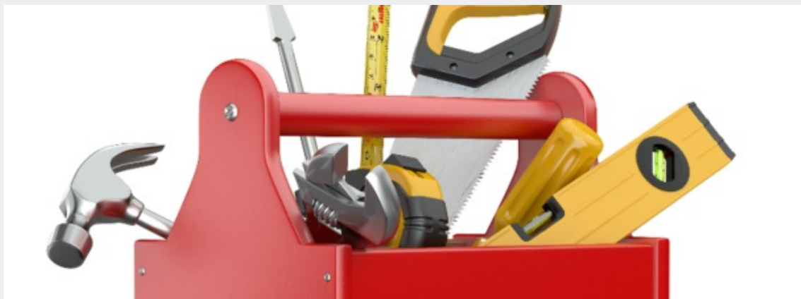
Verktøykassen for lungerehabilitering

Verktøykassen er utarbeidet av nettverk for lungerehabilitering i Helse sør-øst, og er ment å være en hjelperessurs for helsepersonell som ønsker å gi et godt tilbud til lungesyke, individuelt eller i gruppe. Verktøykassen er nå oppdatert med relevant fagstoff om rehabilitering etter covid-19.