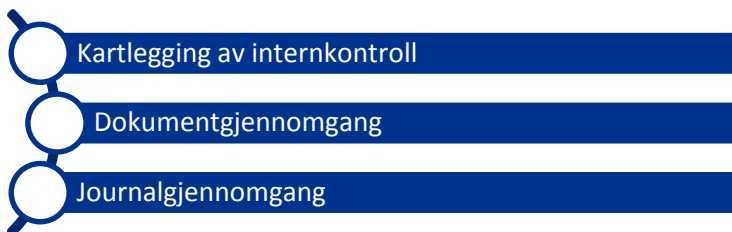
Figur 2: Metoder benyttet i revisjonen.

For å sikre god kvalitet i rettighetsvurderingene må ledelsen påse at det er etablert tilstrekkelig intern styring og kontroll. Internkontrollen skal bidra til at de riktige aktivitetene blir gjennomført med ønsket kvalitet til rett tid, av medarbeidere med tilstrekkelig kompetanse. Videre skal den fange opp og korrigere feil og mangler. Vi har undersøkt Sunnaas sin internkontroll knyttet til arbeidet med å vurdere henvisninger, gjennom dokumentgjennomgang og informasjonsinnhenting.