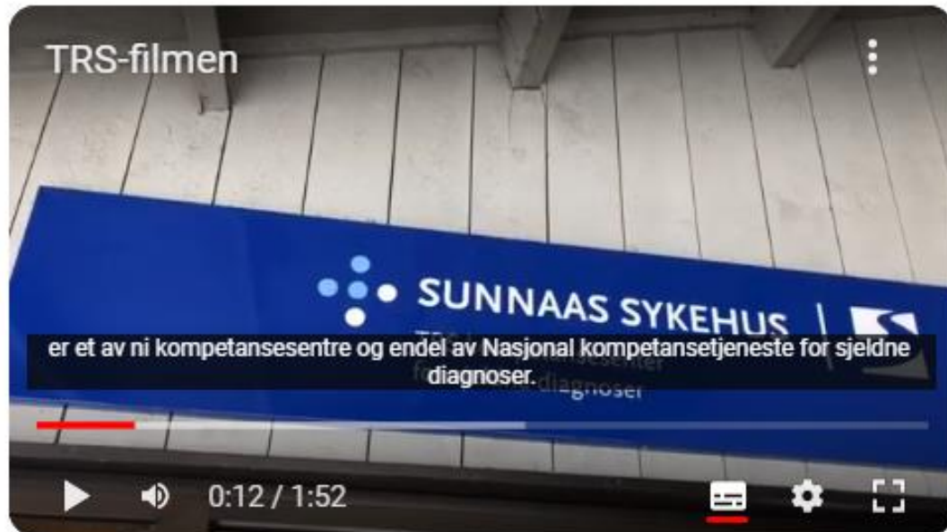
TRS-filmen - YouTube