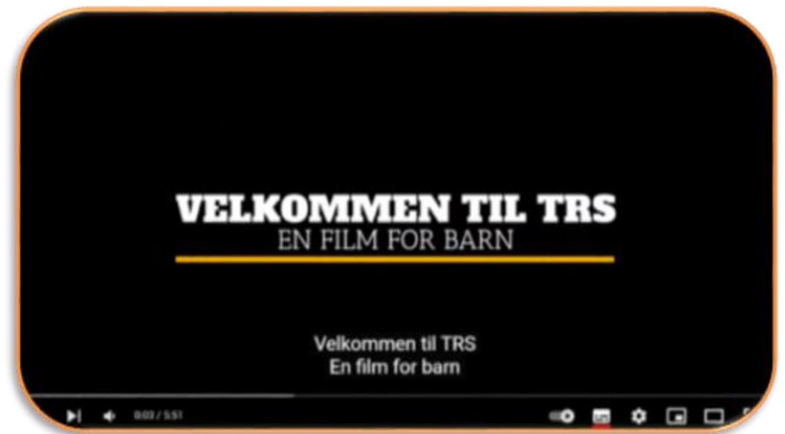
TRS/ en film for barn -YouTube