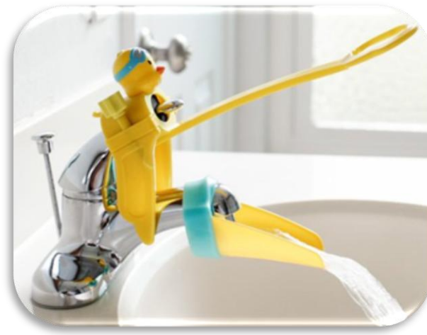
Kran og hendelforlenger fra Aqueduck.com