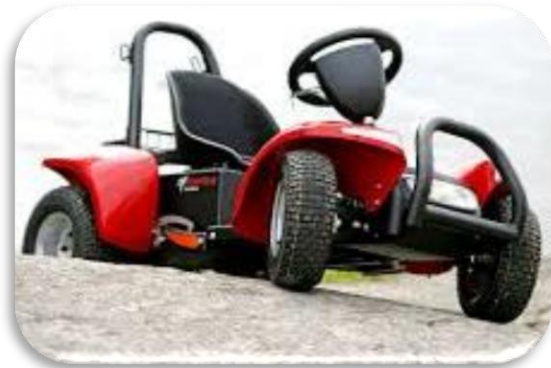
Elektrisk rullestol Raptor