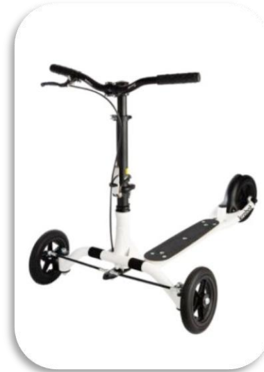
Krabat Runner