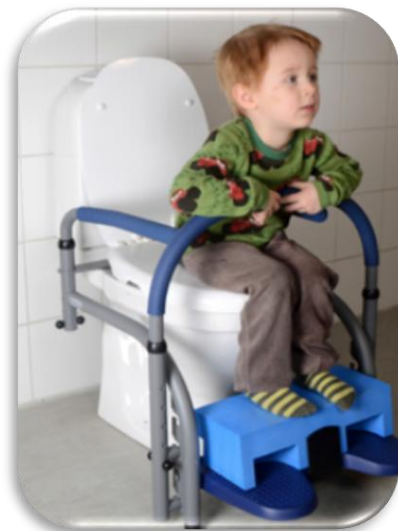
Svan Balance