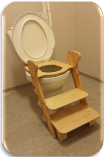
Toalettsete med trinn, Flere typer i vanlig handel