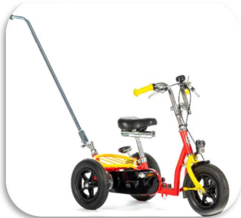
Trehjulsykkel Jippy