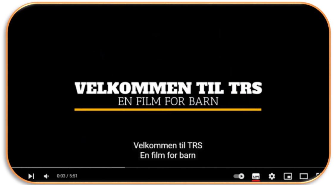
TRS/ en film for barn -YouTube