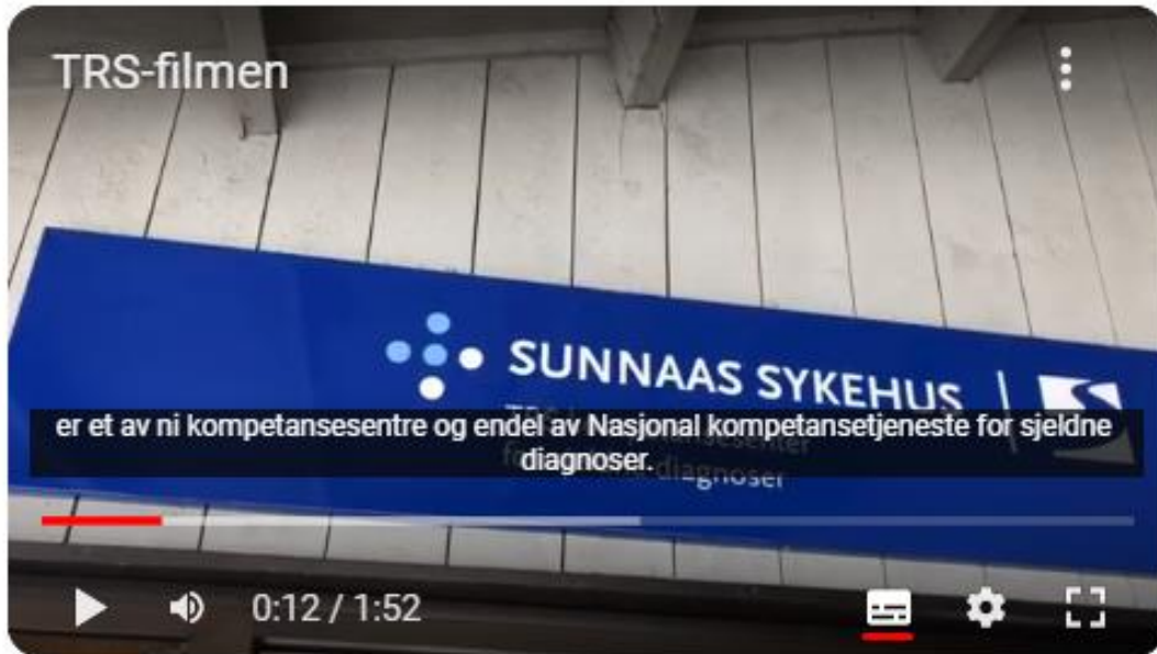
TRS-filmen - YouTube